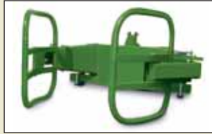
Balya Ekipmanı Max. genişlik 1,8 m