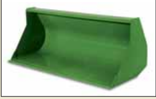
Standart Kova 2,0 m – 0,71 m 3 2,2 m – 0,78 m 3 2,4 m – 0,86 m 3