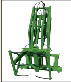
Balya Asansörü Max. genişlik 1,8 m