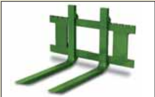
Palet Çatalı 1500 kg