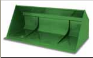
Hububat Kovası 2,2 m – 1,50 m 3