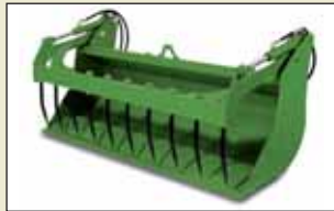
Çok Amaçlı Kova 2,0 m – 0,71 m 3 2,2 m – 0,78 m 3