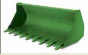
Toprak Kovası 2,0 m – 0,71 m 3 2,2 m – 0,78 m 3